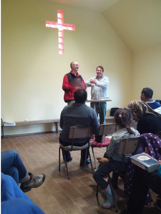
Nieuwe kerk in Boiu.