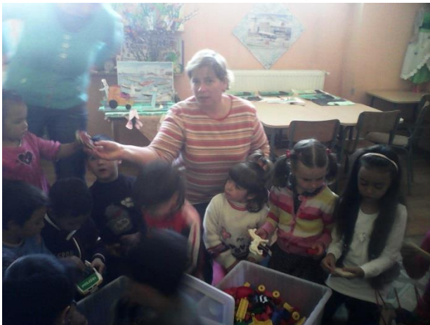
Speelgoed, ook al afkomstig van Philadelphia

Speelgoed voor Vanatori Ook hebben we deze reis speelgoed meegenomen voor een kindergarten (kleuterschool) in de plaats Vanatori. Men is er heel blij mee en hoopt in de toekomst dat we meer komen brengen, want ze hebben verder nauwelijks speelgoed. (Een algemeen probleem in Roemenië)