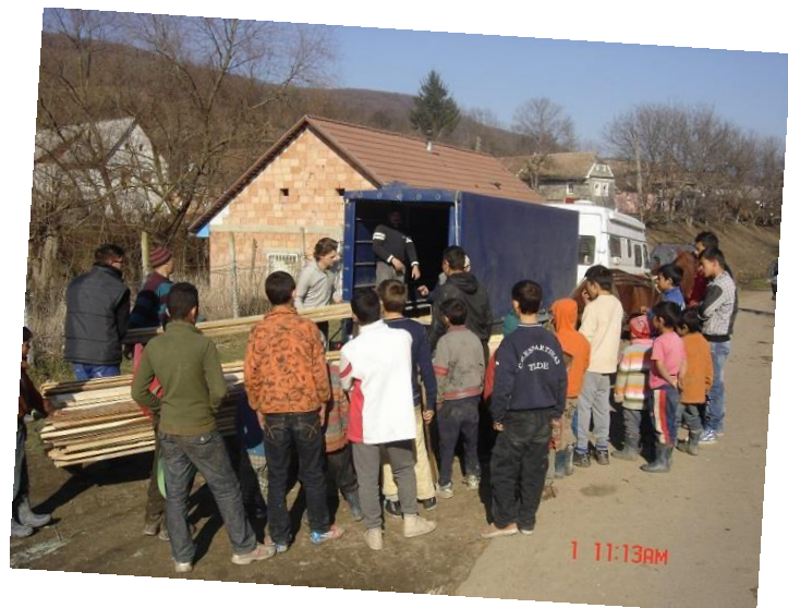
Bouwmaterialen voor Seleus.