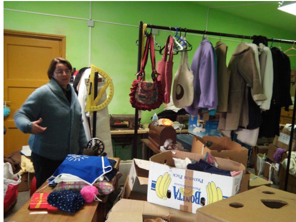
Hier worden de Veritassen gemaakt