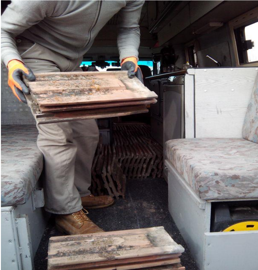
Een aanhanger en camper vol met dakpannen.