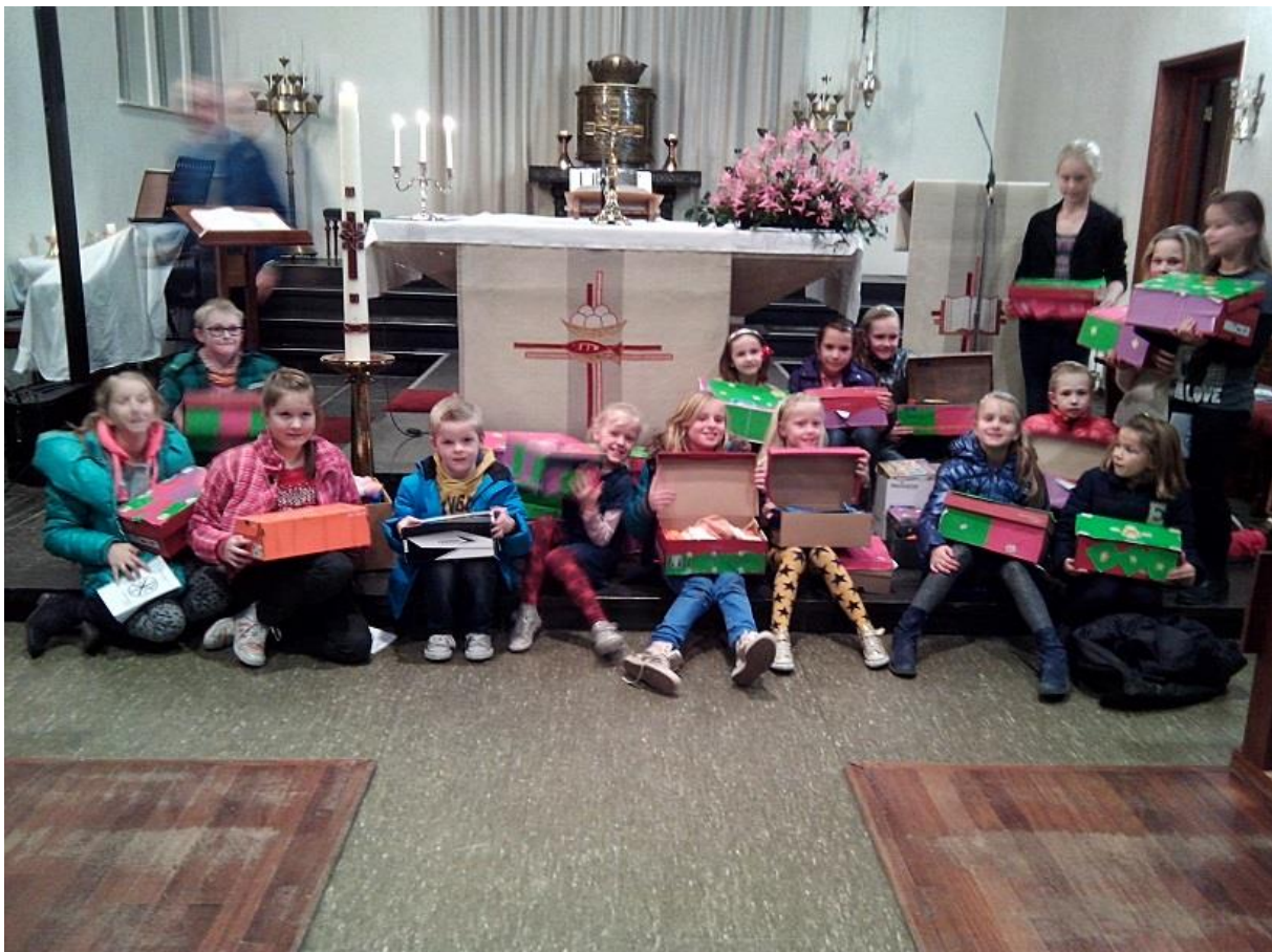
Een deel van de schoenendozen is bij elkaar gebracht door de kinderen van de Spoorbuurtschool uit Anna Paulowna.

Het ingezamelde eten zal samen met kleding en andere noodhulpgoederen én zo'n 280 ingezamelde, met kindercadeautjes gevulde schoenendozen in de week van 9 op 13 december worden ingeladen in een grote trailer. De gevulde schoenendozen zijn bedoeld voor kinderen die opgevangen worden bij Veritas, de organisatie waar de SNR nauw mee samen werkt en heel veel doet voor minder bedeeden in Roemenië.