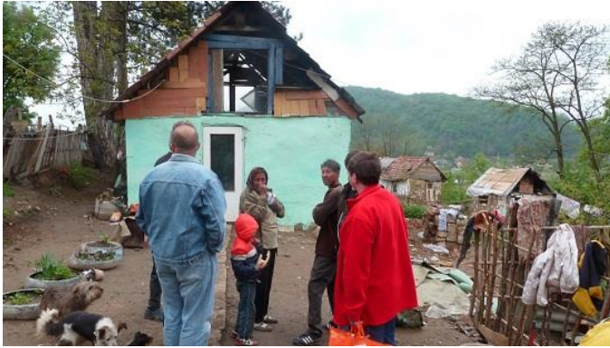
Stefan cel Mare