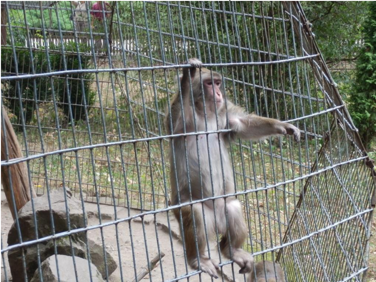
Aap in de dierentuin in Targu Mures.

Kleding sorteren en schuur herindelen Op 14 juni is een groep dames in een heel rap tempo bezig geweest een hele aanhanger vol kleding te sorteren. Ze hadden een halve dag nodig om deze klus te klaren. s 'Middags werd alles weer in de aanhanger terug gelegd en daarmee was deze al grotendeels gevuld voor de komende tocht begin juli naar Roemenië. Een klein deel van de kleding gaat via onze eigen markt de verkoop in. Dit omdat we ook financiën nodig hebben het vervoer.