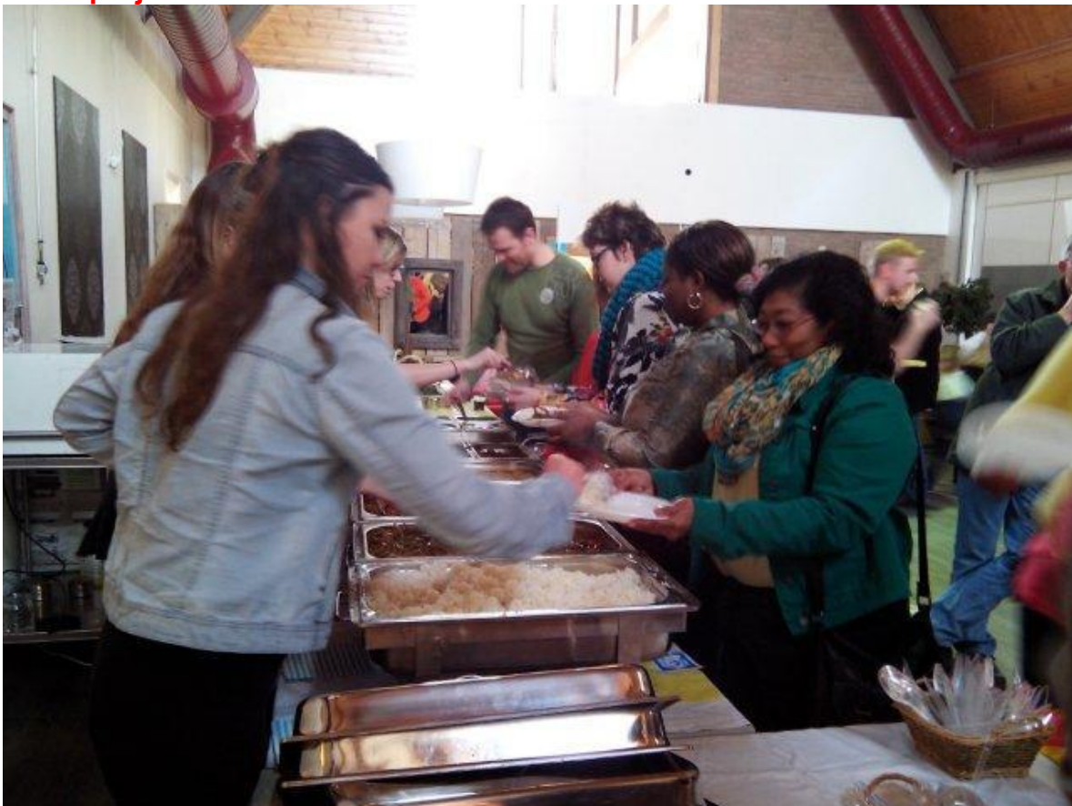
Gemeentemaaltijd bracht ruim 600 euro op.

Ook staan ze in het weekend van 19 tot 21 april op de Afrit 71 . Er staan nog meerdere activiteiten op het programma, maar als u denkt van "dat vind ik geweldig dat deze jongeren dat gaan doen en u wilt hun project ondersteunen? Dan kunt hun project eventueel financieel sponsoren door een bedrag over te maken op rekening van de Stichting Netwerk Roemenië te Hippolytushoef. Het rekeningnummer is 1221.23.182 . Vermeld er wel bij " sponsoring projectkosten zomerproject ".