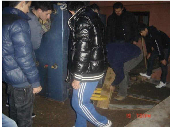
CV installatie uitladen

Op woensdag zijn we o.a. bezig geweest om meubilair van onze opslag naar een familie buiten Sighisoara te brengen. Verder hadden we overleg over ons komend zomer- project en waren we bij het middagprogramma van Veritas.