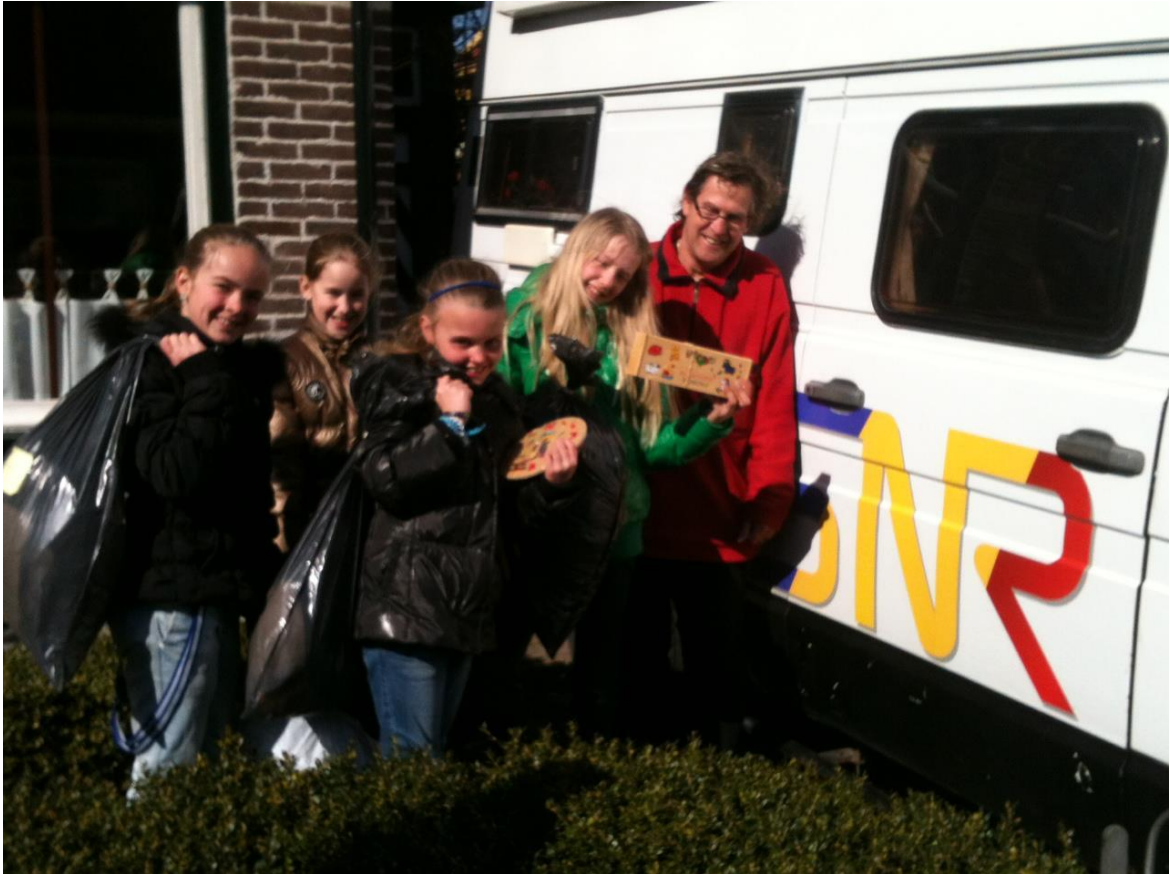
Speelgoed voor kinderen in Roemenië, bijeengebracht deze vier geweldige meiden.

Voorjaarsmarkt Op zaterdag 23 maart jl. hadden we weer een voorjaarsmarkt. Vorig jaar zijn we er niet aan toe gekomen maar nu onze september en novembermarkt moest het nu gewoon doorgaan. Buiten was het deze dag Siberisch koud en dat maakte dat het bezoekersaantal niet al te hoog was. Het aanbod daarentegen was wel groot en er werden dan ook goede zaken gedaan naast al de koffie en het lekkers dat er bij de bar was te halen. We hadden uiteindelijk toch nog een bruto opbrengst van ruim 600 euro. En voorwaar. Dat was niet mis. Een deel daarvan is verdiend door verkoop van de overheerlijke stukken taarten bij de koffie en thee.