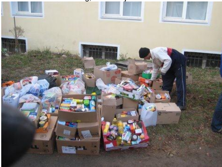
Uitladen deel voedsel winter 2011

Voedselpakket, vervoerskosten of beiden. Overigens is uw gift in de meeste gevallen aftrekbaar van uw inkomstenbelasting, omdat wij een Anbi- status hebben.