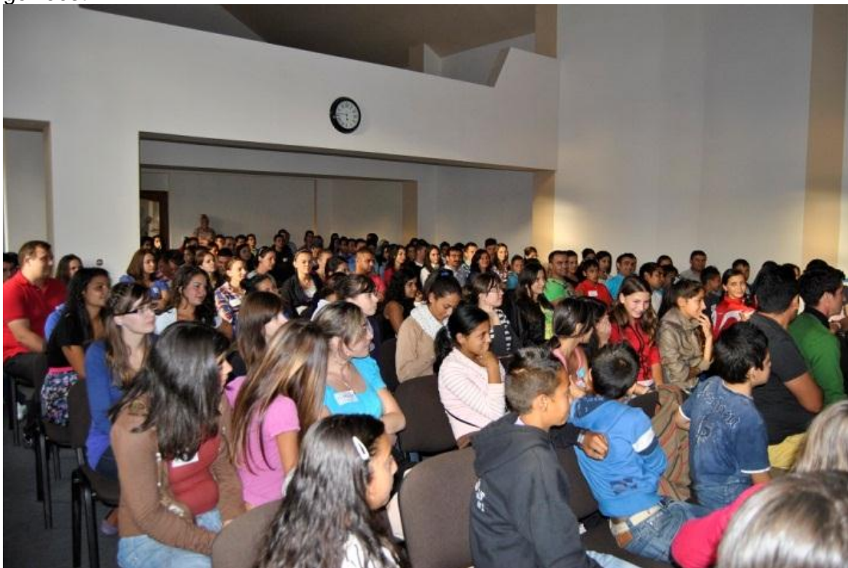
Ruim 120 tieners waren er op de conferentie.

De volgende dag kwamen er ruim 120 tieners in de leeftijd tussen 13 en 18 jaar op dit weekend af. Ik zelf werd op zaterdag ingeschakeld om met een rasechte Dacia, samen met anderen automobilisten, tieners op te halen uit Soard, dat op zo'n twintig kilometer van Sighisoara ligt. Ook van elders kwamen tieners of werden speciaal opgehaald. Ook uit andere kerken vanuit Sighisoara en wijde omgeving kwamen mensen. Het was goed georganiseerd. Veel van de tieners konden blijven slapen en ook was er gezorgd voor maaltijden. Ook was er deze twee dagen een prima Worship- groep uit Rupea, die ook tijdens ons kamp afgelopen zomer erbij waren geweest.