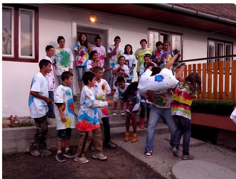
Tieners! Let op wat er rechts gebeurd!! Het loopt gelukkig goed af