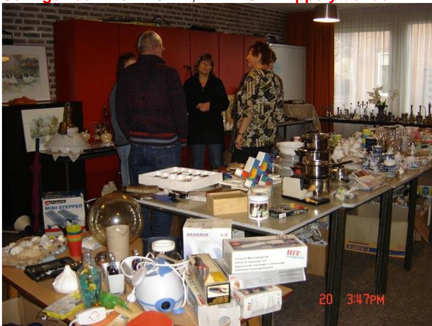
De rommelmarkt van 22 september jl. bracht bijna €700,- op.

Dus.....we zien u graag op zaterdag 24 november tussen 10 en 16 uur aan de Seringenlaan nummer 17, 1777EC in Hippolytushoef .