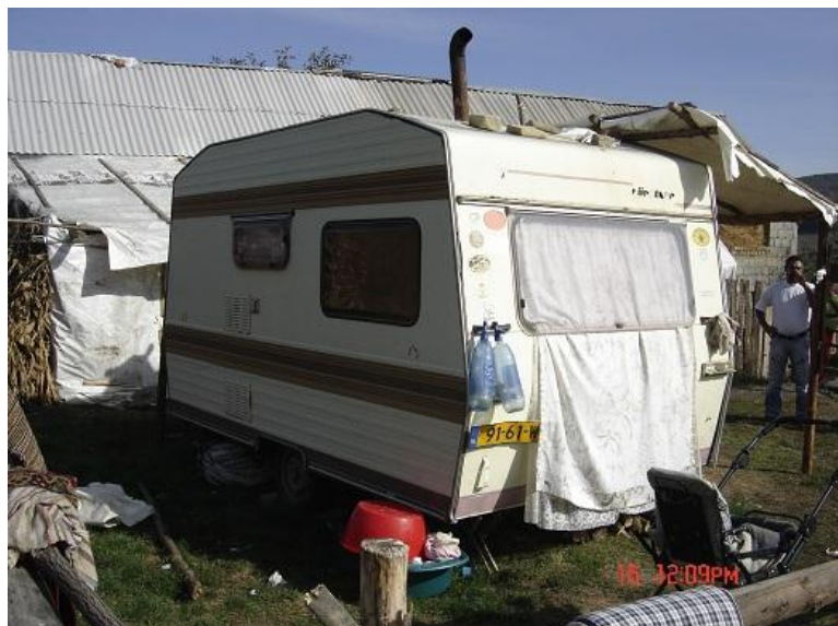
Leven in een caravan

Project "Traian": Verder was het deze week aanvankelijk de bedoeling om met meerdere mensen te gaan bouwen voor kinderen die onder bizarre omstandigheden alleen wonen in een krotwoning omdat de vader is overleden en de moeder al enige jaren in Duitsland leeft.