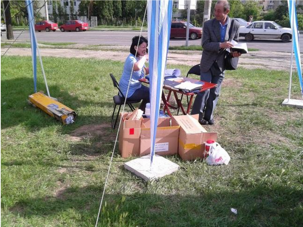
Gratis bijbel voor wie er geen een heeft maar wel wil hebben en lezen