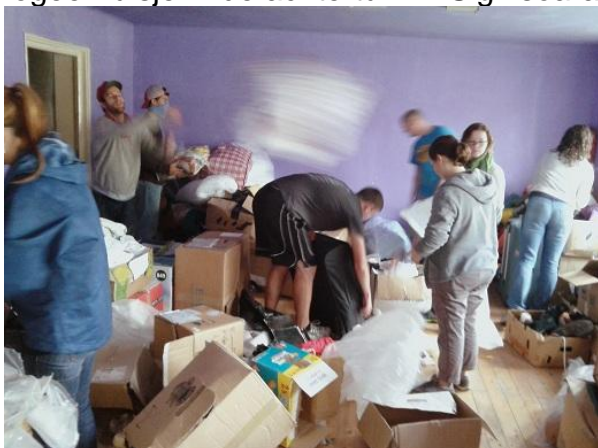
Amerikanen ruimen op