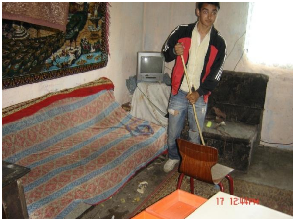
De oudste in huis. 17 jaar.