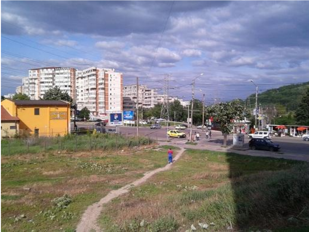
Zicht op Iasi. De op één na grootste stad van Roemenië

De volgende dag komt de vrachtwagen aan die de zaterdag ervoor in Slootdorp is geladen. Met een behoorlijke groep hebben we die uitgeladen. Men is erg blij met de spullen en met een aantal kerken gaan ze de armen er mee verblijden. Helaas heb ik geen foto's gemaakt. Er zit vooral veel speelgoed bij. Want na m'n eerste bezoek in 2010 had ik beloofd speelgoed voor de allerarmsten te sturen om met de kerstdagen uit te delen. Maar door overvloedige sneeuwval kon het speelgoed niet gebracht worden want er was geen verkeer mogelijk. Afgelopen winter herhaalde zich dat waardoor ik het besluit heb genomen het ver van te voren te brengen.