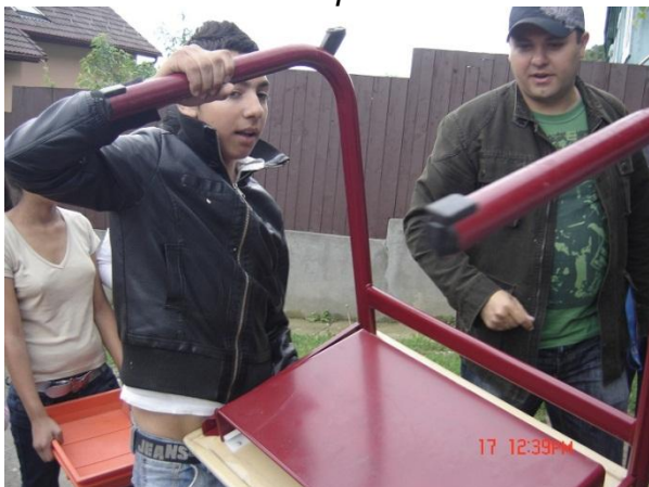
Schoolmeubelen voor wie wil leren