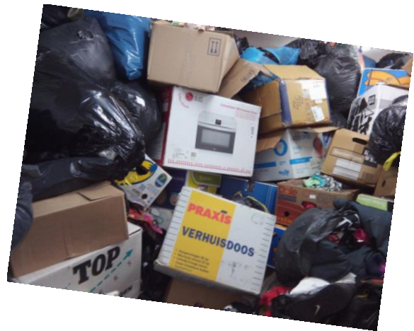
Voedsel en andere hulpgoederen aangekomen in onze opslag in Sighisoara.

Verder werd het opnieuw een indrukwekkende tijd waarbij de kerstsfeer in alles al overal te proeven viel. Dat wordt in Roemenië veel meer tot uiting gebracht op een niet- commerciële basis. Veel kerken hebben activiteiten zoals het zingen van kerstliederen. Al met al heb ik veel mensen bezocht, ook in de dorpen. Op maandag 23 december, vlak voor de kerst, zat m'n missie er op en kon ik me weer bij mijn gezin melden.