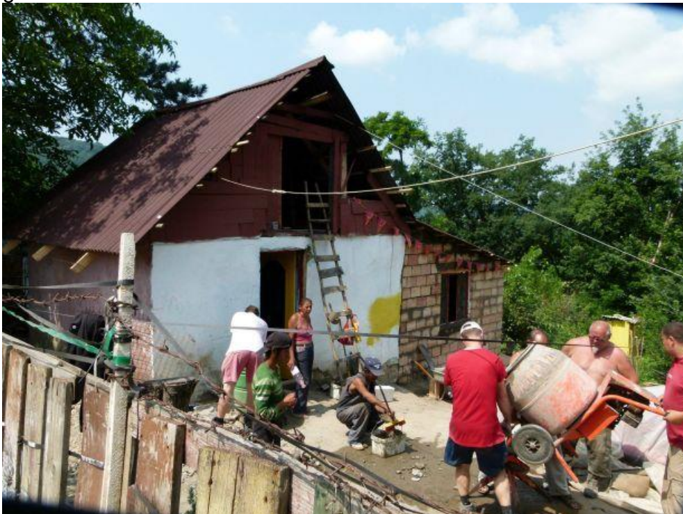
Bouwactiviteiten in 2013

Voor info mail efrelink@solcon.nl of bel me(0634315171) gr Bas Frelink.