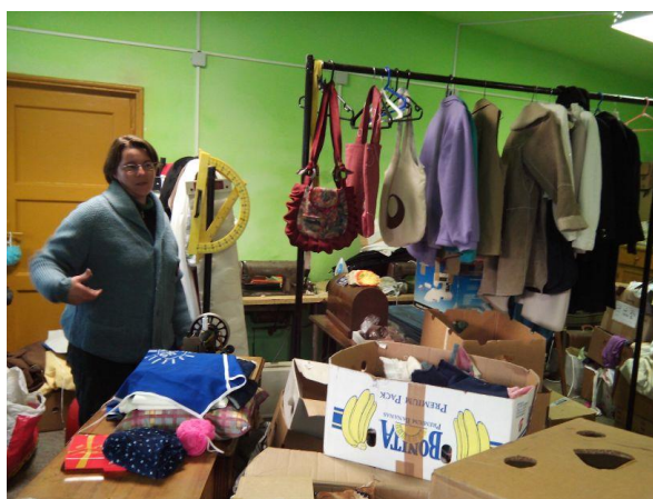
Hier worden de Veritassen gemaakt