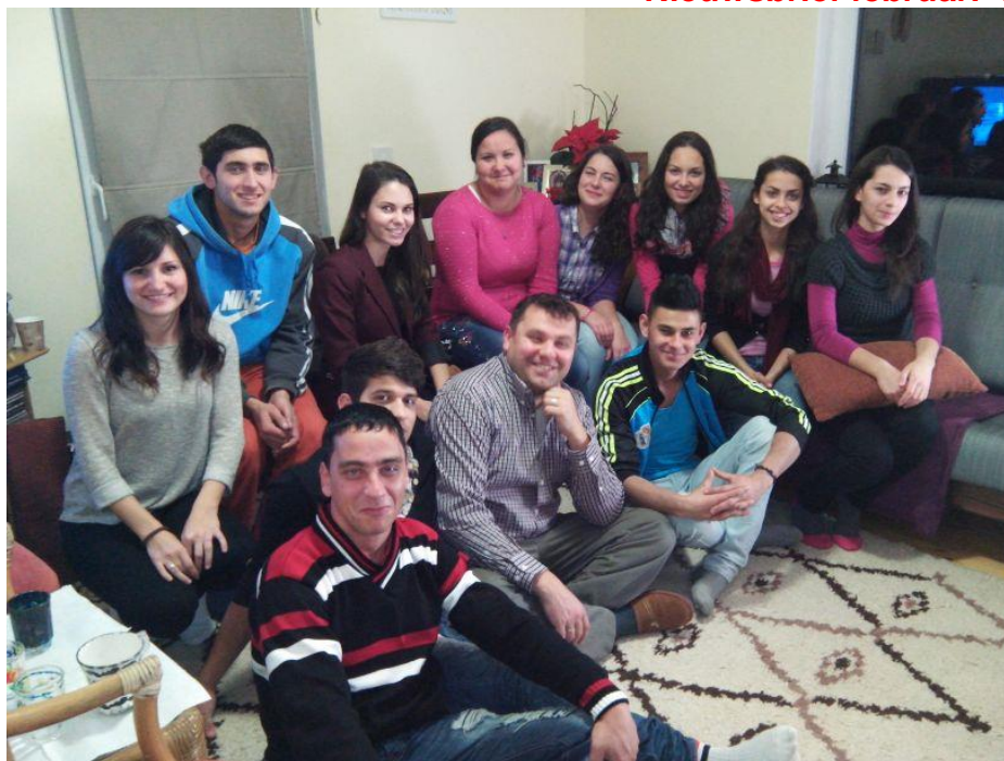
Deze Roemeense jongeren komen komende zomer naar Nederland!

Van de voorzitter: Voor mij nog twee dagen en dan gaat de volgende tocht naar Roemenië alweer plaats vinden. Amper twee maanden na de vorige tocht is er al weer genoeg reden om er, overigens voor mij voor de vijftigste keer, naar toe te gaan. In deze nieuwsbrief kunt u daar veel meer over lezen. 2014 is nog jong maar we barsten weer van de activiteiten.