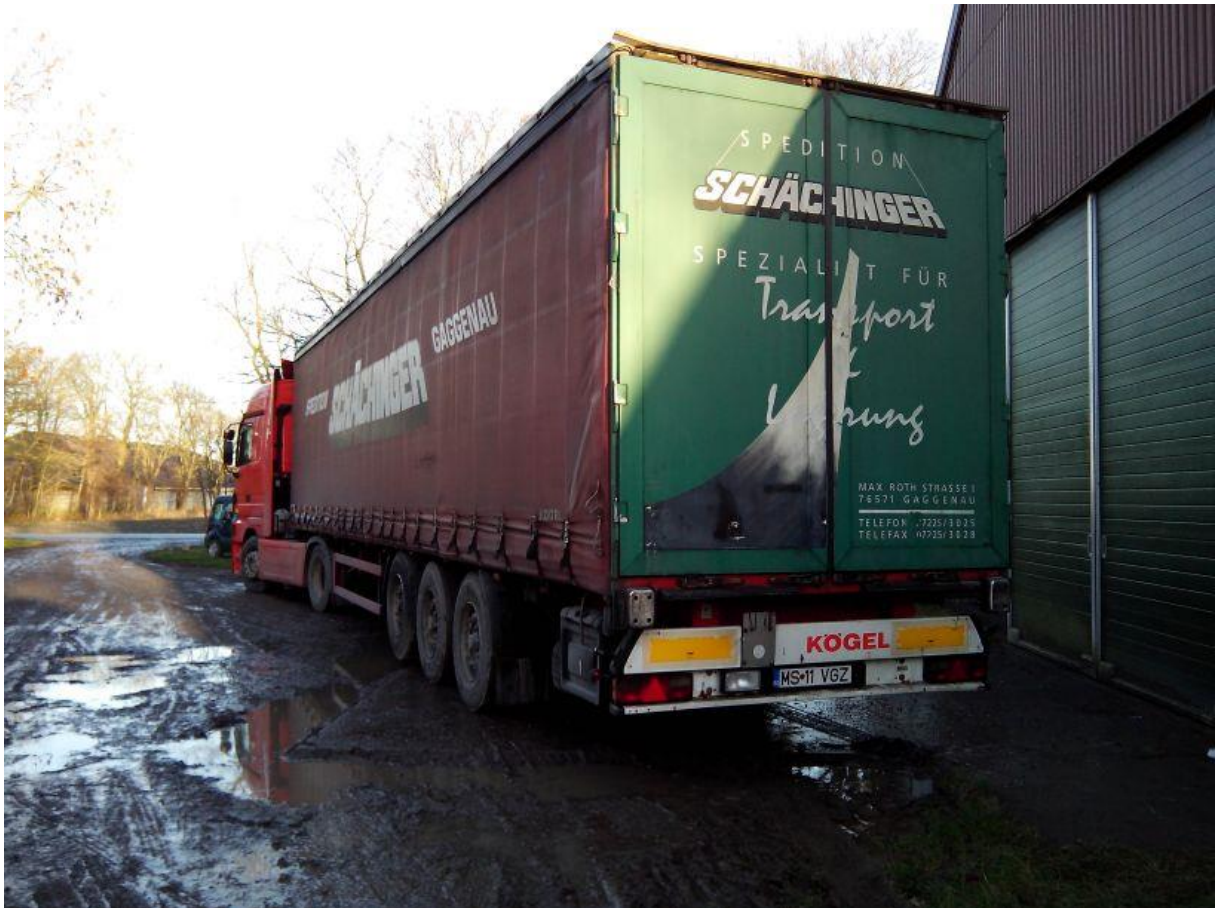
Nicu vertrekt met zijn trekker en oplegger vanuit Slootdorp richting Sighisoara.