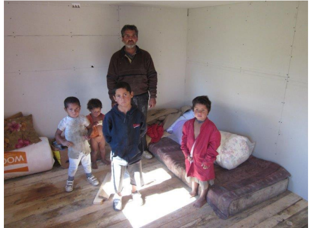
Blik in het huisje