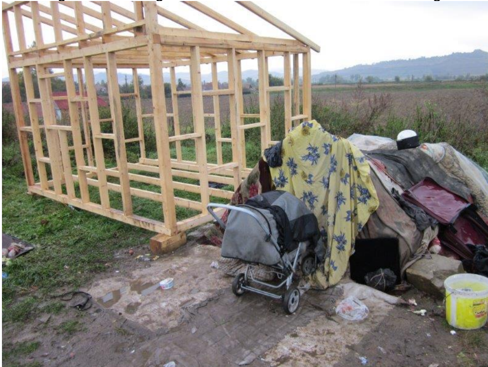
Het skelet is gebouwd

Nadat wij de oproep hadden geplaatst werd er zeer spontaan gereageerd en binnen twee dagen konden we David vertellen dat hij voor €1.095,- aan bouwmaterialen kon kopen. Hij had nog een extra gift van €500,- en daarmee kon het hele huisje afgebouwd worden incl. isolatie en kachel. Hij had op dat moment al een houten skelet gebouwd maar dat moest nog helemaal af gemaakt worden. Binnen een week kreeg ik nieuwe foto's