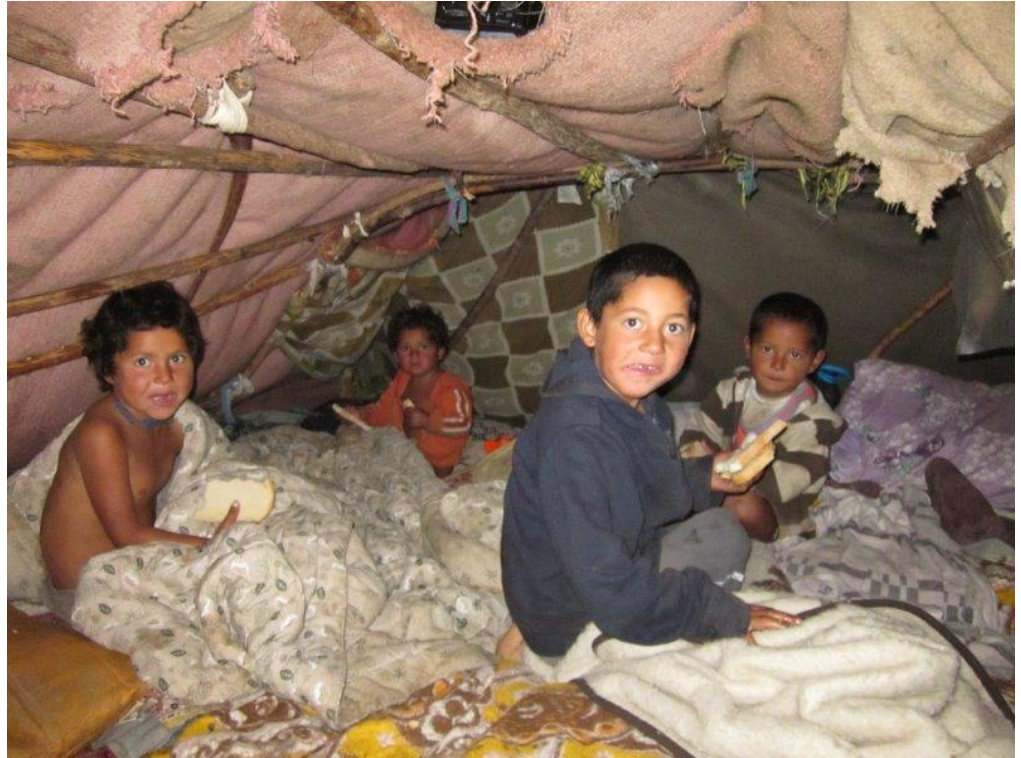
Blik in de tent.