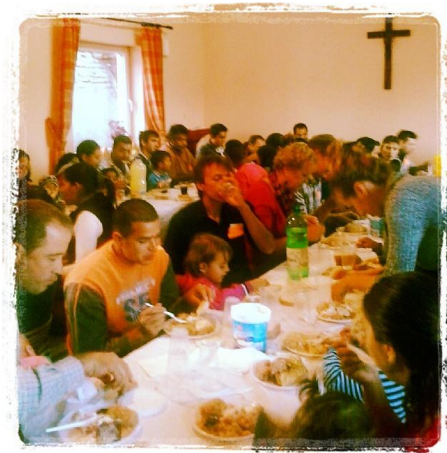
Onderwijs over huwelijk in Soard.

Op het moment dat ik dit schrijf (28 oktober) zijn ze er ook en geven aan een groep ouders en jongeren in Soard studie over het onderwerp "huwelijk" en wat de waarde van het huwelijk is. Naast Roemenië heeft stichting springplank overigens ook een project in India en een project in Indonesië. U kunt nader kennis met ze maken op de markt.