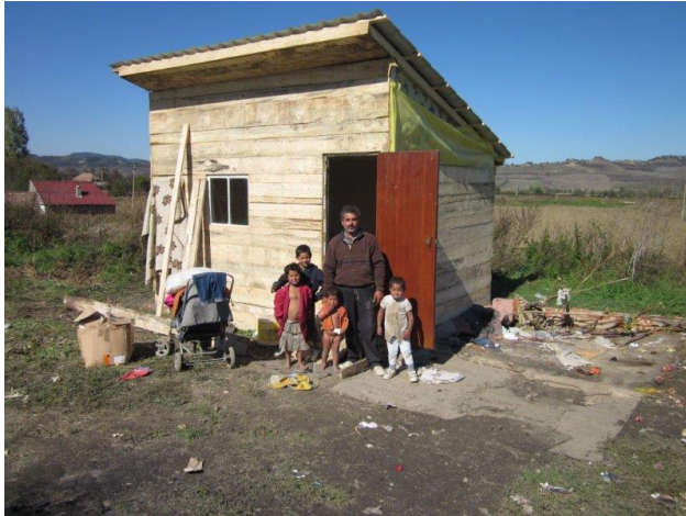
Het huisje is al bewoonbaar