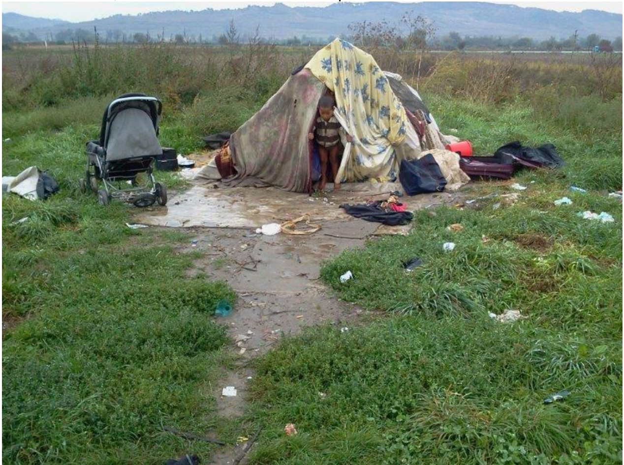
Dit bouwsel moest een “tent” voorstellen.