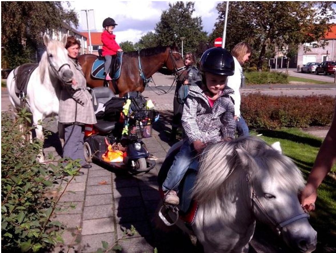
Paard rijden was een succes.

Wilt u Stichting Netwerk Roemenië blijvend steunen? Wordt dan vaste donateur! Des te meer zekerheid wij hebben over onze inkomsten, des te meer zekerheid we ook in Roemenië kunnen geven over waar we structureel de allerarmsten mee kunnen helpen!