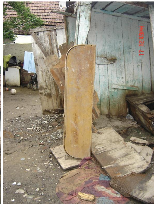
Het sanitair buiten

Voor meer informatie, neem contact op. Mail naar info@stichtingnetwer kroemenie.nl