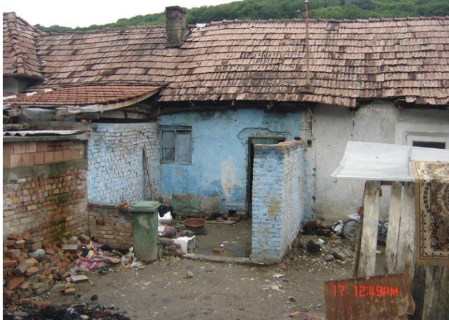
Het huis waar de kinderen in wonen

Uiterlijk volgende week woensdag hoop ik zekerheid te geven of de missie door kan gaan of niet. Strijdt mee voor ons doel!! Treedt biddend ten strijde.