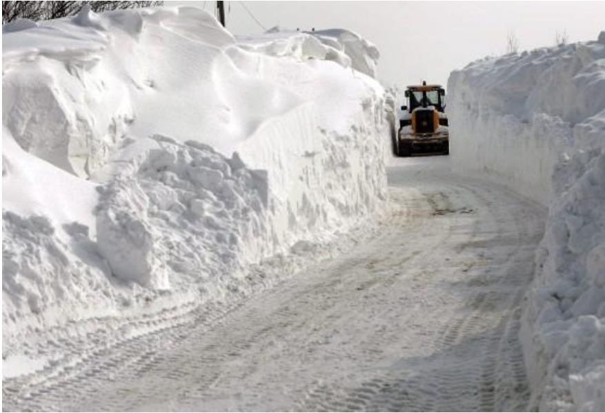
Bijna geen verkeer mogelijk

Hoe is het in onze eigen regio? Ook vanuit Sighisoara krijgen we vele noodoproepen. Een paar weken geleden arriveerde ons tweede transport met voedsel, samen met de uitzuigmachine van Petruta, een aantal rolstoelen, kleding, conserven bijeengebracht door de school de “Wegwijzer” uit Opperdoes en een ton aardappelen + een ton uien.