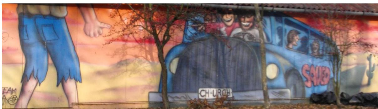
Muurschildering op de camping van Dorcas in Debrecen (Hongarije)

Van de voorzitter: Het is de hoogste tijd voor een nieuwsbrief.